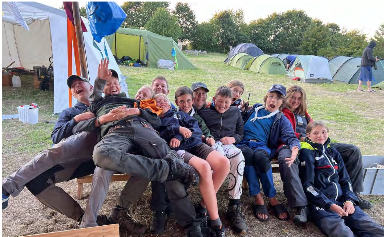
Sociale tropspejdere (øverst) og juniorer på storskibssejlad (nederst)